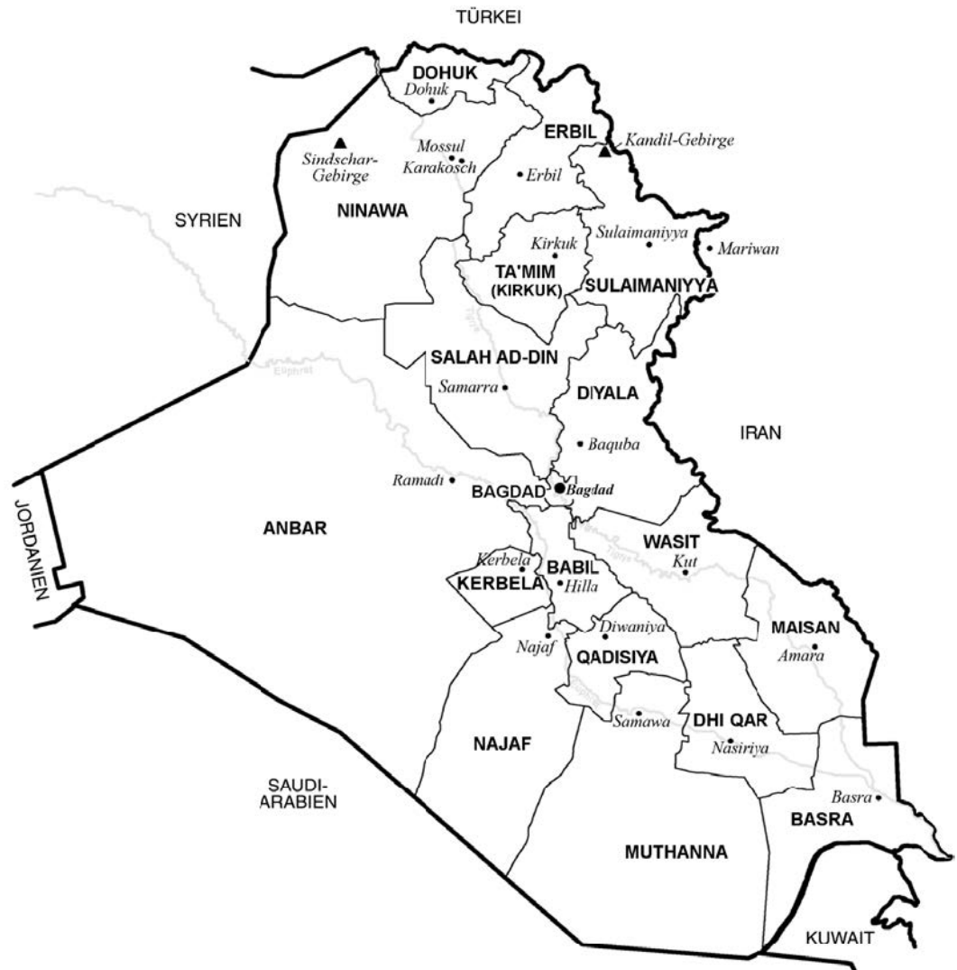
Karte 3 Irak

zusätzliche Einnahmen im Sicherheitssektor zu generieren. Mit Blick auf die bestehenden Sanktionen gegen Russland und die ungelöste Krise um die Ukraine kann Moskaus gewachsene Bedeutung in Nahost darüber hinaus »leverage« für entsprechende Verhandlungen erzeugen. Denn die Ausweitung des russischen Engagements auf den Irak ist auch ein Signal an die internationale Staatengemeinschaft, dass der im September 2015 begonnene Militäreinsatz in Syrien kein Einzelfall bleiben muss und Russland auf absehbare Zeit ein sicherheitspolitisch relevanter Akteur in der MENA-Region (Nahost und Nordafrika) bleiben wird. Damit führt in einem von zahlreichen Konflikten geprägten und geostrategisch bedeutsamen Raum kaum mehr ein Weg an Russland vorbei.