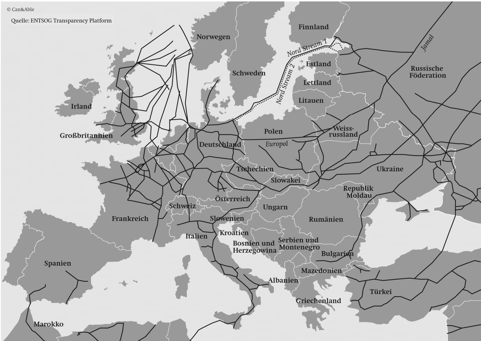
Karte 4: Europas Fernleitungsnetz