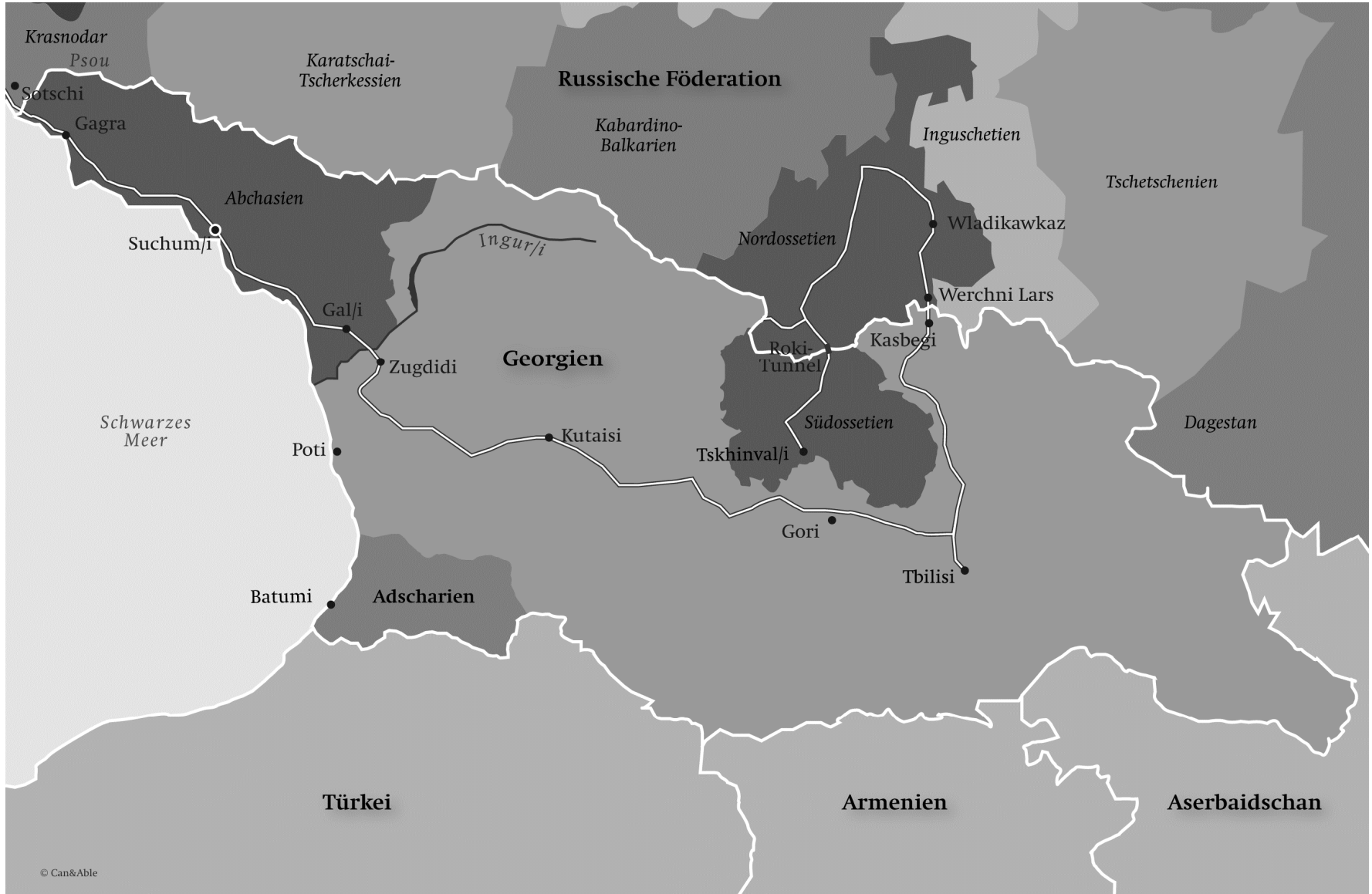
Karte 6: Georgien im regionalen Umfeld