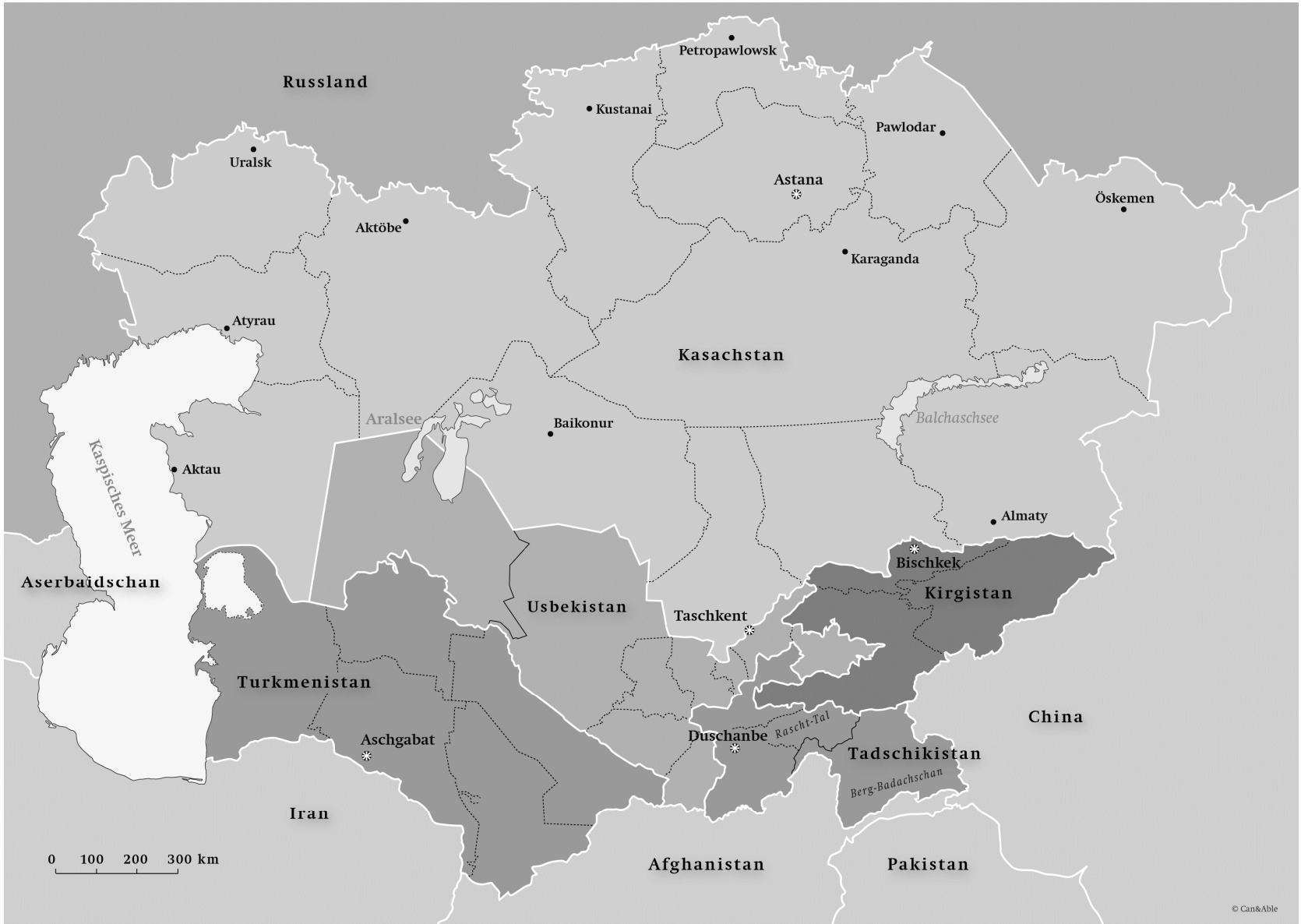
Karte 5: Zentralasien